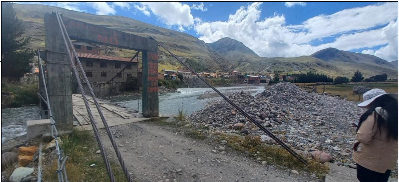
FOTOGRAFIA N°03: TRAMO DE INTERVENCION CON ENROCADO EN LA MARGEN IZQUIERDA DEL RIO MAPACHO, SE APRECIA VIVIENDAS Y UN PUENTE.