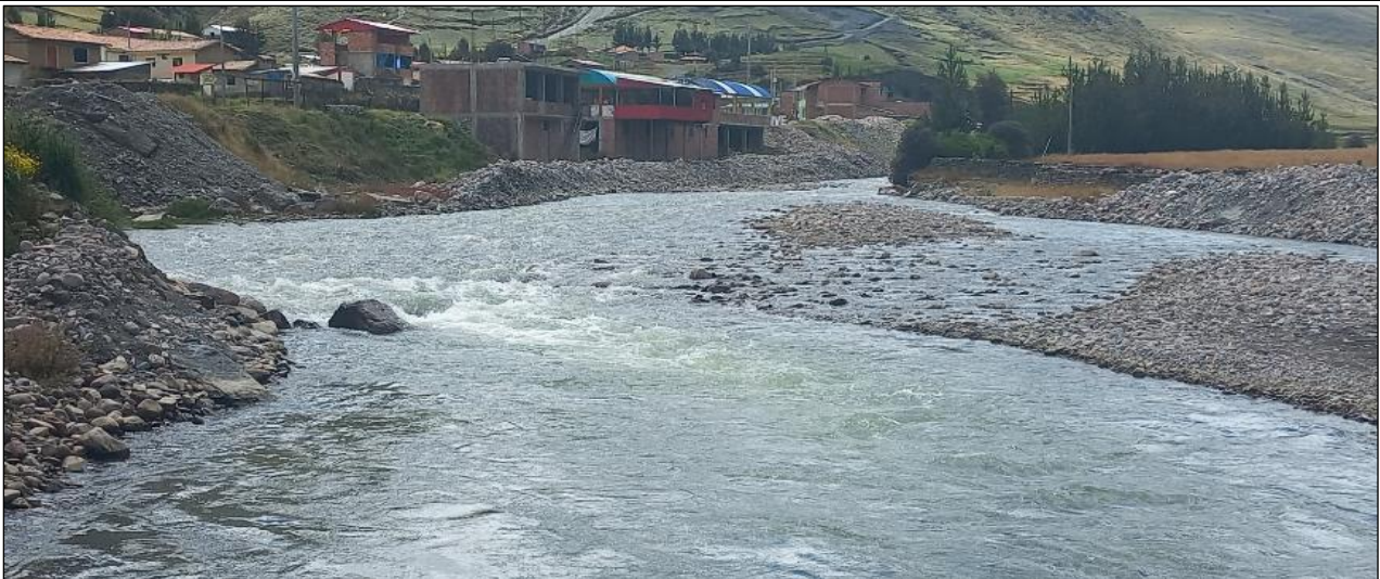
FOTOGRAFIA N°01: TRAMO DE INTERVENCIÓN CON ENROCADO EN LA MARGEN DERECHA DEL RÍO MAPACHO, EXISTE RIESGO DE POSIBLE INUNDACIÓN Y CAUCE COLMATADO.