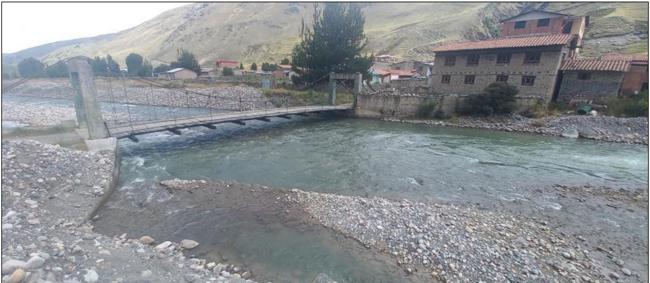
FOTOGRAFIA N°02: TRAMO DE INTERVENCION CON ENROCADO EN LA MARGEN DERECHA DEL RIO MAPACHO, SE APRECIA PUENTE Y VIVIENDAS POSIBLEMENTE VULNERABLES.